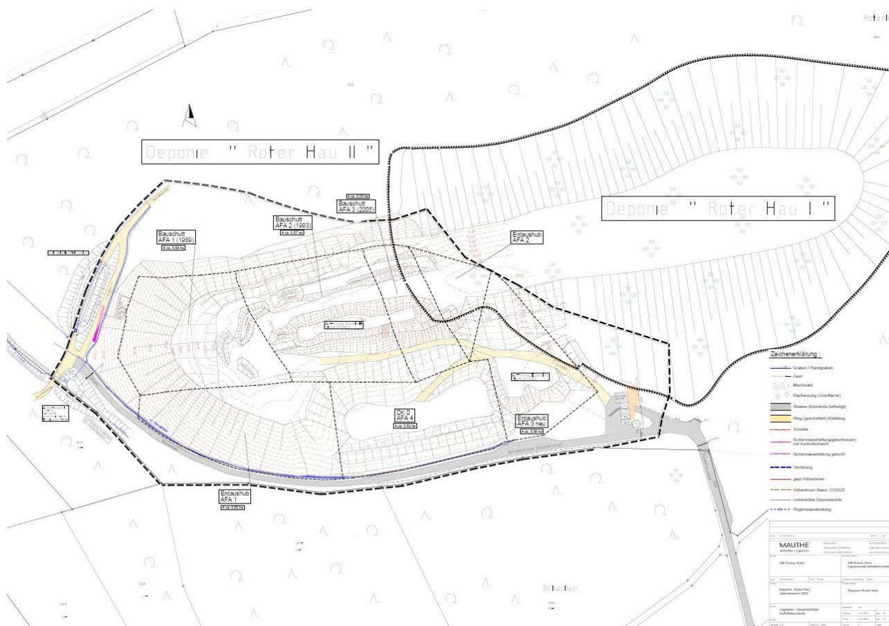
Abbildung 2: Deponie „Roter Hau“ (mit Bauabschnittskennzeichnung)